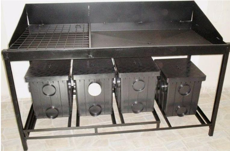
Figura 6 – Bancada de lavagem de peças com caixas de separação de água e óleo.

Em relação às manchas de óleo no piso e potencial absorção deste, vindo a contaminar o terreno, verifica-se como uma solução que é de exigência legal, porém inviável financeiramente. O custo médio de aplicação de impermeabilização representará um custo de R$ 85,00/m 2 sendo um investimento que precisaria ser compartilhado com os proprietários do imóvel, porém não é de comum acordo entre o empresário e o locador. Verifica-se manchas de óleo em praticamente toda extensão do piso da mecânica.