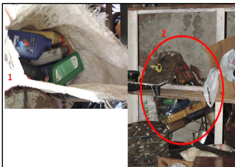
Figura 5 – Acondicionamento dos frascos de óleo

Na figura 5 pode se verificar falta de padronização no acondicionamento dos frascos de óleo vazios, no item 1 – os frascos estão acondicionados em um saco de nylon que se houver restos de óleos pode escorrer e contaminar o saco de nylon e o local, item 2 – os frascos estão acondicionados em um saco plástico que é o ideal, entretanto está em um local não apropriado e em ambos os casos não é realizado a separação da tampa do frasco. Estes frascos o empresário paga para a Paraná Ambiental recolher.