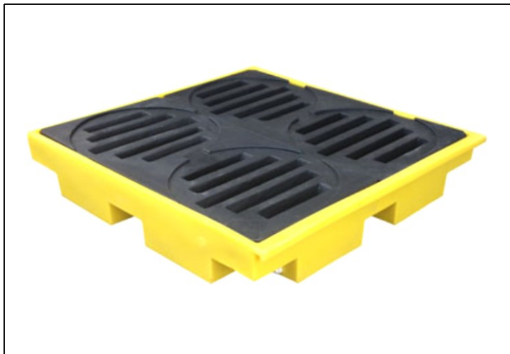
Figura 8 – Pallet de retenção de óleo

Na figura 8 apresenta-se um modelo que atenderia as necessidades do proprietário e ao mesmo tempo poderia posteriormente ser realocada para novas instalações caso necessário, a aquisição de uma peça representaria um custo médio de R$ 1200,00.