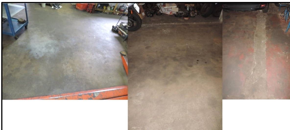
Figura 6 – Inexistência de piso impermeável – manchas de óleo por todo piso.

A figura 6 demonstra que a oficina não possui piso impermeável e possui vestígios de óleo nos pisos, entretanto o empresário informou que não é feita a lavagem dos pisos com água, a higienização é realizada com um pano úmido e também é tomado o cuidado para que não pingue óleo no piso.