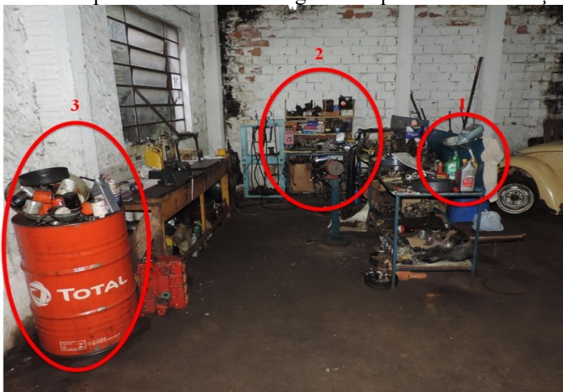
Figura 1 – Óleos novos e usados

Apresenta-se assim na figura 1 as primeiras observações do local.