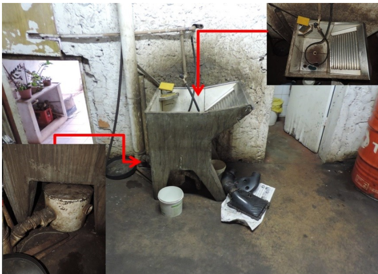
Figura 2 – Local de lavagem.

Na figura 2, observa-se o local onde acontece a limpeza das peças usadas e das mãos dos colaboradores da oficina. Existe, de forma precária, uma caixa que separa a água e o óleo, após a separação a água vai para o esgoto e o óleo fica armazenado na caixa e posteriormente é colocado no tambor para óleos velhos.