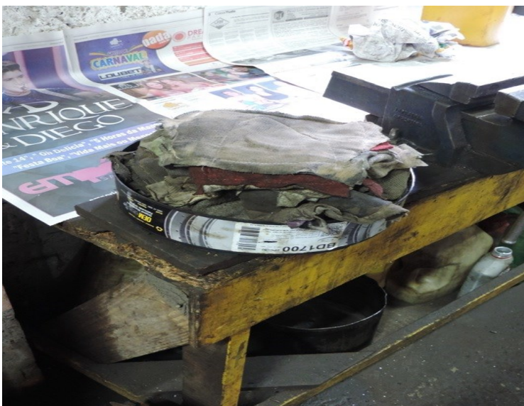
Figura 3 – Estopas utilizadas.

Pela figura 3 percebe-se o acúmulo de estopas utilizadas e que o empreendedor paga para empresa Paraná Ambiental as recolher.