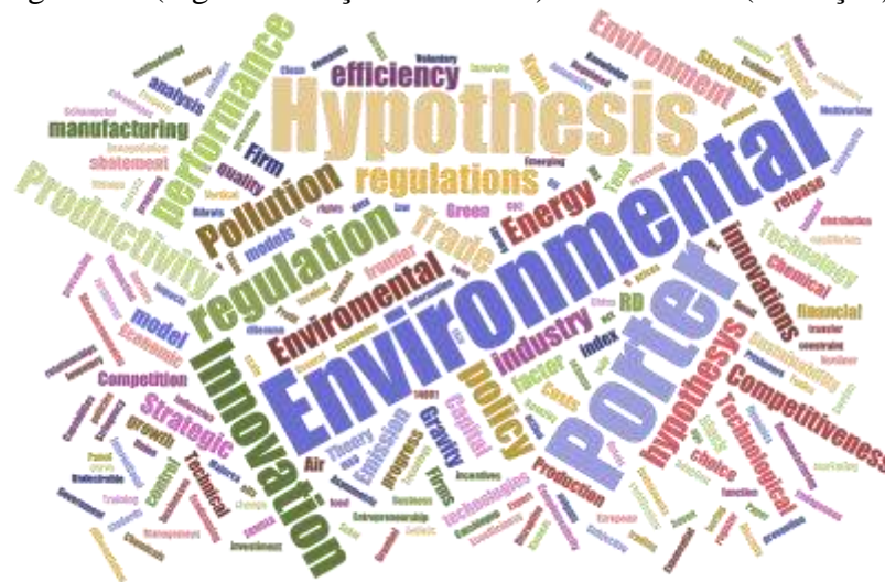
Figura 2. Nuvem de palavras

Com relação ao número de autores por artigo, 10% apresentaram quatro autores, 22% três autores, 35% dois autores e 33% apenas um autor, deve-se ressaltar que em nenhum dos artigos havia mais que quatro autores. Quanto às palavras chaves houve uma variação entre 2 a 6 por artigo, dessa forma, obteve-se 142 palavras distintas. Observa-se na Figura 2, que representa uma nuvem de palavras desenvolvida por meio da ferramenta online Word Cloud , que a palavra mais citada nas palavras-chaves foi Porter Hypothesis (Hipótese de Porter), Environmental Regulation (regulamentação ambiental) e Innovation (inovação).