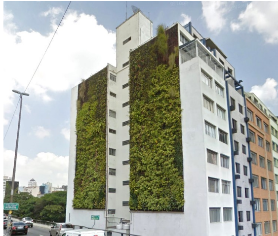
Figura 5 – Edifício Huds – Empena Verde

Os moradores do Edifício Huds aprovaram a intervenção, como pôde-se constatar pelas entrevistas realizadas pelos pesquisadores. Segundo estes, após a implantação da empena verde, melhoraram as condições de conforto térmico interno nos apartamentos, houve ganho na umidade do ar do entorno e redução dos ruídos advindos do tráfego de veículos. Os moradores entrevistados também demonstraram a percepção de valorização do imóvel e da região do entorno após a execução do jardim vertical.