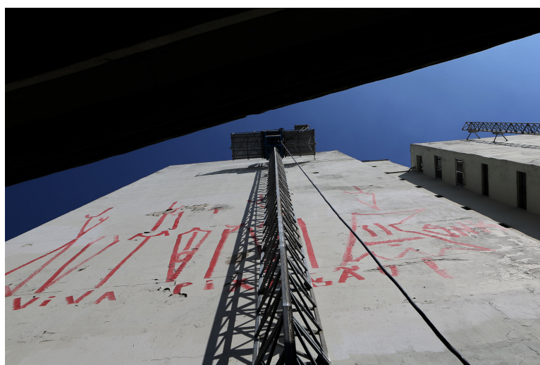
Figura 2 – Empena cega do Edifício Huds.

O primeiro edifício de São Paulo a receber a empena verde como forma de compensação ambiental foi o Condomínio Edifício Huds, localizado na Rua Helvétia, nº 965, na região central da cidade, com a fachada que recebeu a intervenção voltada para o Elevado Presidente João Goulart. O jardim foi instalado em uma empena cega, caracterizada por ser uma parede externa lisa e sem aberturas, a Figura 2 mostra a empena cega do Edifício Huds, que possui área de 302m 2 , antes do início da intervenção.