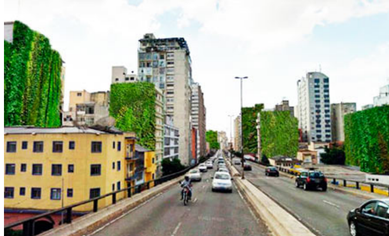
Figura 6 - Proposta de implantação em potenciais edifícios nas imediações do Elevado Presidente João Goulart.

O Movimento 90° (2016) afirma que a iniciativa agrega benefícios não só paisagísticos, mas principalmente ambientais e que está previsto que 20 edifícios irão receber nos próximos cinco anos, a empena verde como compensação ambiental na região. A figura 6 ilustra a proposta do Movimento 90° (2016), com várias empenas verdes nos edifícios que apresentam potencial de implantação, nas imediações do Elevado Presidente João Goulart.