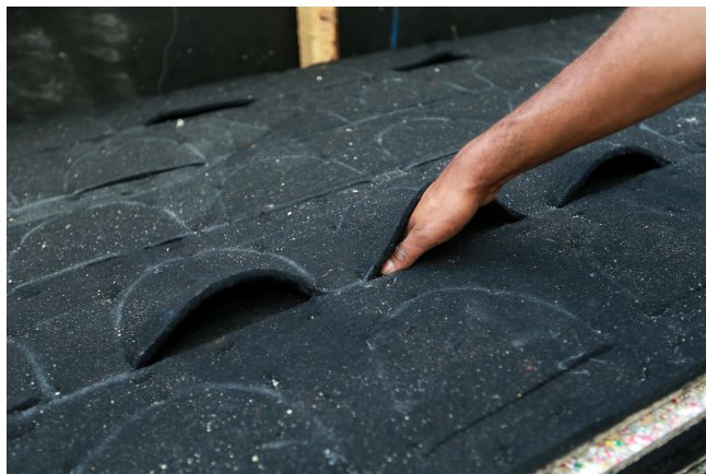
Figura 4 – Módulo montado com as camadas de feltro.

Antes da fixação, os módulos foram montados individualmente, com as duas mantas de feltro grampeadas à placa ecológica, sendo que na segunda foram abertos rasgos horizontais, de cerca de 20 cm, onde se formaram os bolsos que receberam as mudas de planta, conforme mostrado na figura 4.