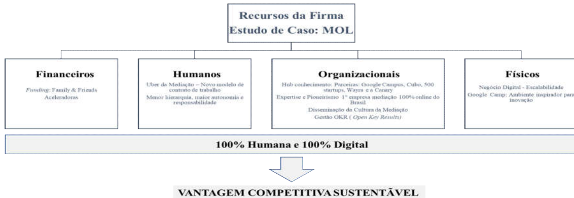
Figura 1. Recursos da Firma

A Figura 1 demonstra os recursos da firma aplicados no modelo de negócio da MOL: