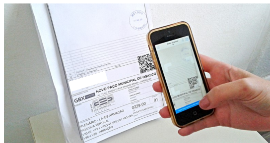
Figura 3. Visualização de Versão de plantas utilizando o QR-Code

Esta ferramenta controla as permissões de acesso aos arquivos digitais e suas revisões, garantindo que a revisão atualizada esteja disponível para todos os intervenientes no processo e não haja cópias de arquivos obsoletos em uso pela equipe de produção e sua gestão. A troca dessas informações é feita através de um QR-Code, constante nos carimbos de projetos, conforme Figura 3.