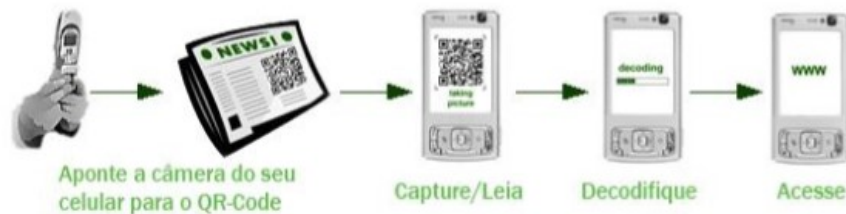
Figura 2. Processo de leitura de um QR-Code via dispositivo móvel

meio dos dispositivos móveis é fácil e intuitiva, conforme Figura 2, basta baixar o aplicativo no aparelho celular, enquadrar o código com a câmera, o próprio aplicativo ajuda no enquadramento, e após a identificação e decodificação do QR, é exibido o conteúdo armazenado no ambiente digital (Silva, 2013).