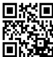
Figura 1. Aparência do QR-Code

A criação e desenvolvimento dos códigos QR emerge da necessidade de expandir a capacidade dos códigos de barras convencionais, pois o mercado consumidor precisava que mais informações fossem mediadas através de uma solução mais prática e ágil. Para suprir a demanda, o QR-Code possui a capacidade de armazenar 354 vezes mais informações que o código de barras, além de aceitar todos os tipos de caracteres (Kanji, Kana, símbolos etc). Sua velocidade de leitura é 10 vezes mais rápida devido a utilização de marcações delimitadas pelos quadrados em suas extremidades conforme Figura 1 (Silva, 2013).