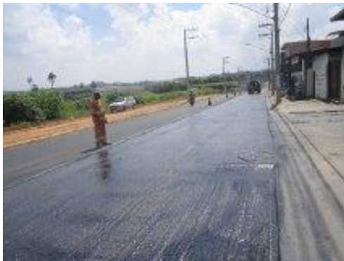
Figura 8. Imprimação Ligante

Imprimação ligante: Pintura asfáltica executada sobre a camada de ligação para promover a coesão à superfície da camada pela penetração, dando maior aderência aos vazios promovidos pelos agregados (Senço, 1997).