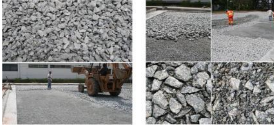
Figura 16. Execução da camada de macadame betuminoso

Imprimação ligante: Mesmo conceito do pavimento convencional, porém diluído em maior proporção sendo de tipo CM-30 na proporção de 0,8 litros/m 2 . A aplicação é feita à quente de maneira rápida, para dar aderência aos grãos para que se unam sem diminuir significativamente o teor de vazios, e mantendo a porosidade. Deve ter gradação aberta, e resistência suficiente aos esforços impostos pelo tráfego, além de conferir boa resistência ao cisalhamento, para dar suporte a camada de CPA (Virgillis, 2009).