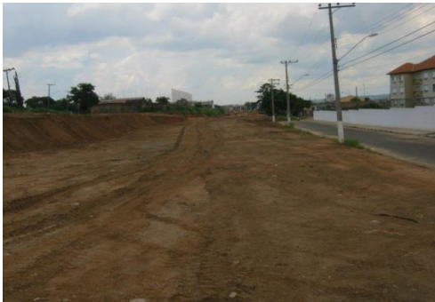
Figura 2. Subleito

Subleito: Terreno de fundação do pavimento. As estradas em tráfego há algum tempo e a qual se pretende pavimentar, que tenha superfície irregular, exige a regularização (Senço, 1997).