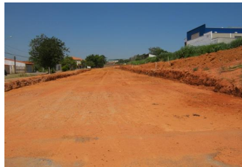
Figura 3. Regularização

Regularização: Camada de espessura irregular, construída sobre o subleito e destinada a conformá-lo, transversalmente e longitudinalmente, com o projeto. Deve ser executada sempre em aterro (Senço, 1997).