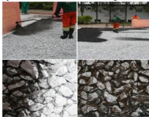
Figura 17. Aplicação de imprimação

Imprimação ligante: Mesmo conceito do pavimento convencional, porém diluído em maior proporção sendo de tipo CM-30 na proporção de 0,8 litros/m 2 . A aplicação é feita à quente de maneira rápida, para dar aderência aos grãos para que se unam sem diminuir significativamente o teor de vazios, e mantendo a porosidade. Deve ter gradação aberta, e resistência suficiente aos esforços impostos pelo tráfego, além de conferir boa resistência ao cisalhamento, para dar suporte a camada de CPA (Virgillis, 2009).