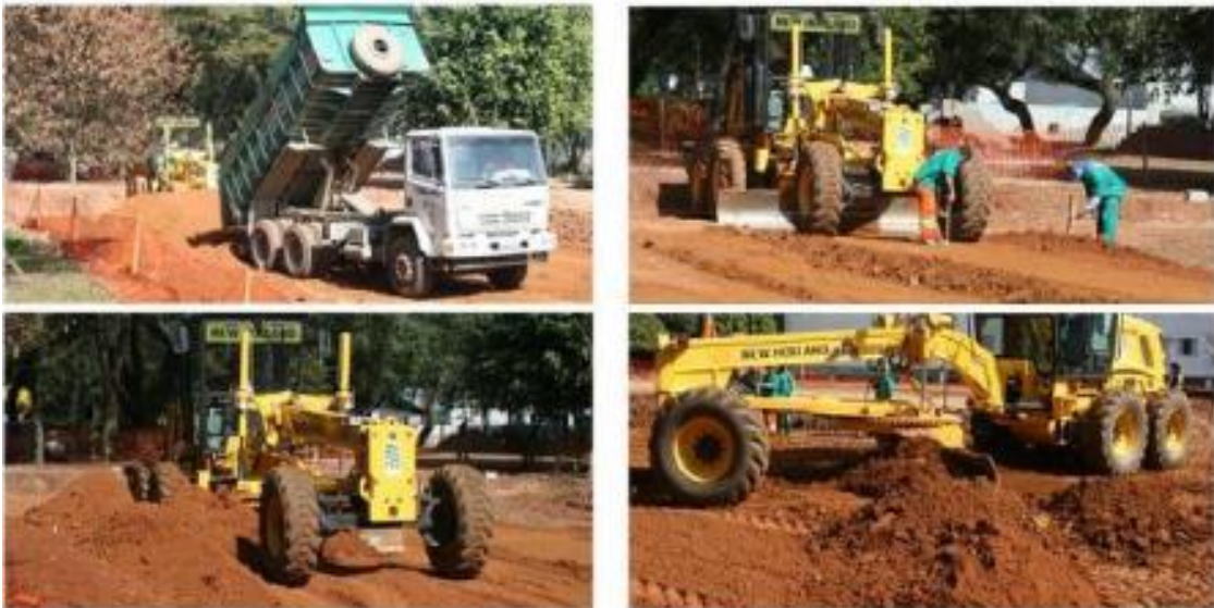
Figura 13. Espalhamento e nivelamento de solo para reforço

Reforço do subleito: Camada estabilizada granulometricamente, executada sobre o subleito compactado e regularizado, para reduzir espessuras elevadas da camada sub-base, originadas pela baixa capacidade de suporte do subleito. (DNER-ES 300/97).