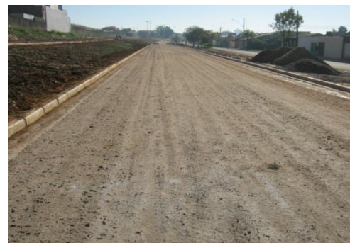
Figura 5. Sub-base