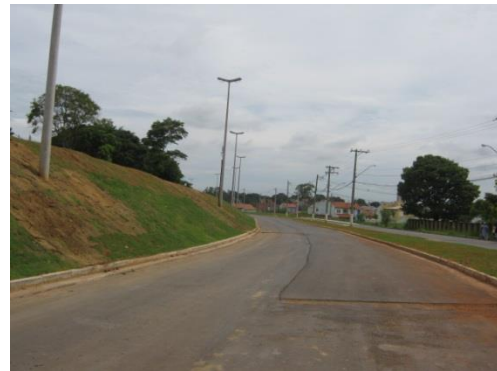
Figura 9. Capa