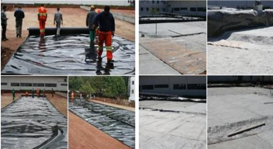
Figura 14. Assentamento de geomembrana