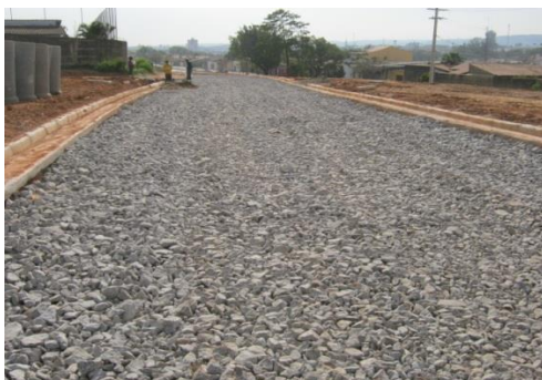
Figura 4. Reforço do Rachão

Reforço do subleito: Camada estabilizada granulometricamente, executada sobre o subleito compactado e regularizado, utilizada para reduzir a espessura da sub-base originada pela baixa capacidade de suporte do subleito (Senço, 1997).