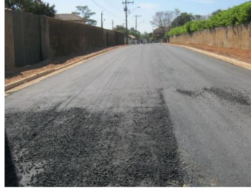
Figura 7. Binder

Camada de Ligação: A camada de ligação conhecida como “ Binder ” é a mistura utilizada abaixo da camada de rolamento, geralmente apresenta maior porcentagem de vazios e menor consumo de ligante em relação à camada de rolamento (Senço, 1997).