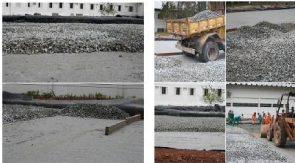
Figura 15. Espalhamento de macadame hidráulico (pedra 3)

Sub-base: O conceito da sub-base para pavimentos porosos é o mesmo do convencional, porém com granulometria maior (Virgillis, 2009). Na camada do reservatório utiliza-se pedras com diâmetros entre 40 mm a 75 mm (pedra brita n. 3 e n. 4), para congelamento do solo a profundidades que pode variar de 0,61m a 1,22m e o reservatório deverá drenar em 24h a 72h o volume d'água. Se o pavimento for voltado para armazenamento, deverá ser executada uma camada macadame hidráulico para servir como reservatório e camada de Brita Graduada Simples [BGS], porém antes da camada de BGS executa-se o salgamento com pó de pedra (Virgillis, 2009).