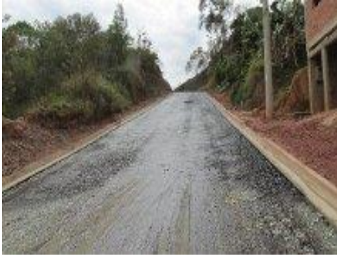
Figura 6. Imprimação impermeabilizante

Imprimação impermeabilizante: É a aplicação de uma película de material betuminoso sobre a base, com o objetivo de aumentar a coesão da superfície imprimada, impermeabiliza a camada anterior e aumenta a aderência com a camada superior (Senço, 1997).