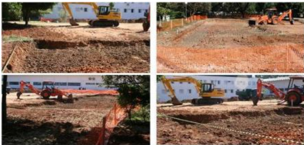
Figura 11. Abertura e preparo de caixa

Virgillis (2009) ressalta que poucos pavimentos possuem todos os componentes listados, pois cada pavimento tem uma combinação específica que atenda suas necessidades técnicas.