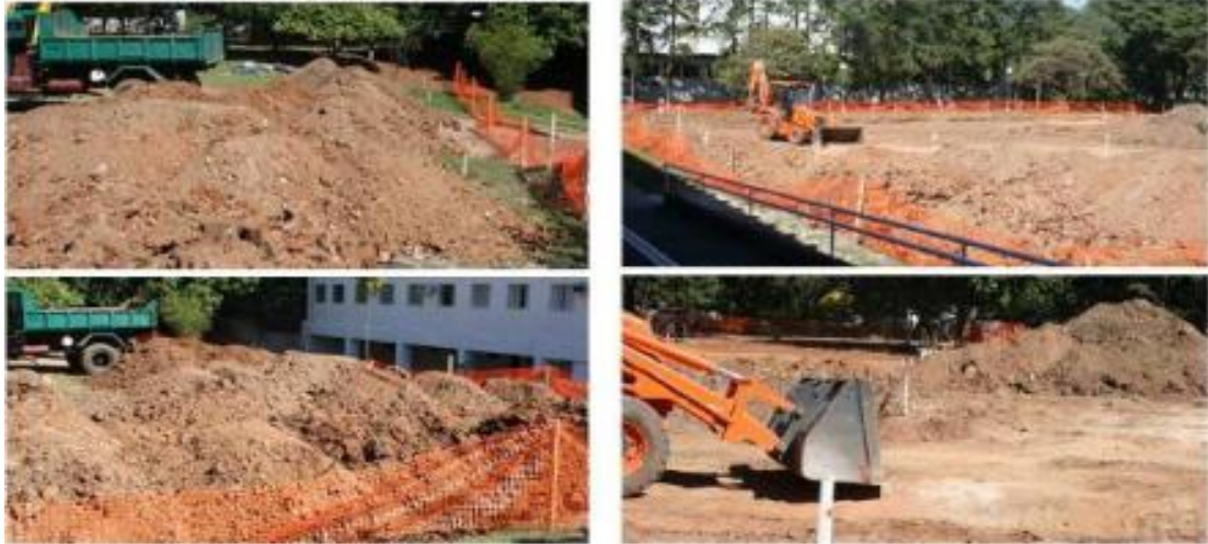
Figura 12. Terraplanagem - preparação para o aterro

Terraplanagem: Tem como objetivo a conformação do relevo terrestre, podendo ser necessário a utilização de solo de jazida (Castro, 2013).