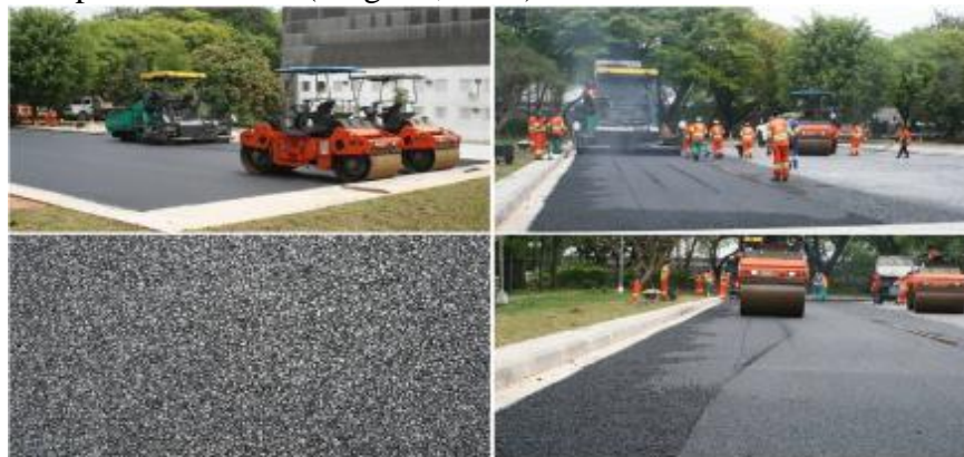
Figura 18. Execução do revestimento

Revestimento: Camada final que no revestimento poroso é denominada de Concreto Asfáltico Poroso [CPA] é a parte mais importante do pavimento. Deve-se ter cuidados com produção, transporte e aplicação. Requer mão de obra qualificada para obter máximo desempenho de permeabilidade (Virgillis, 2009).